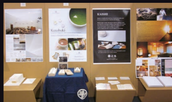
参加企業のPRパネル。