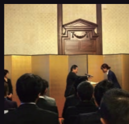
表彰式(京都府庁日本館・正庁)