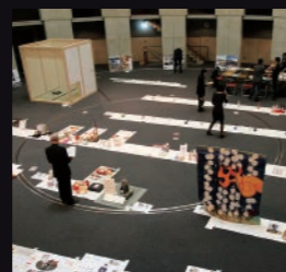
審査会場(京都市立芸術大学)

ジャンルを超えて個人や企業から応募されたデザイン作品が、審査会場の京都市立芸術大学・円形ホールに集結。指先ほどの小さな小物から茶室まで、個性豊かなデザイナーたちが話し合ってくるような賑わいでした。多くの応募作品から選ばれた作品とデザイナーは後日、京都府庁「秋の観芸祭」での表彰式で表彰されました。