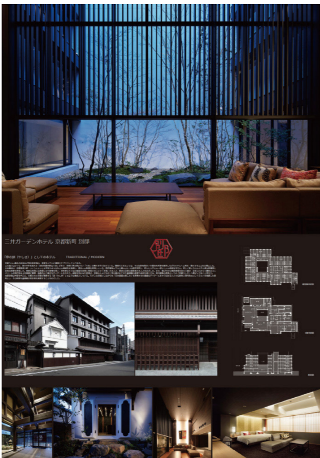
大賞 三井ガーデンホテル 京都新町 別邸

また、11月9日(日)に行われた表彰式、作品講評会、交流会には、行政関係、審査員、入賞・入選者、KDA会員等の多数が参加しました。