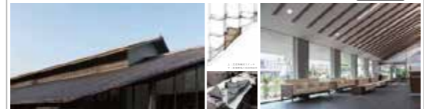
大賞 京都銀行西七条支店