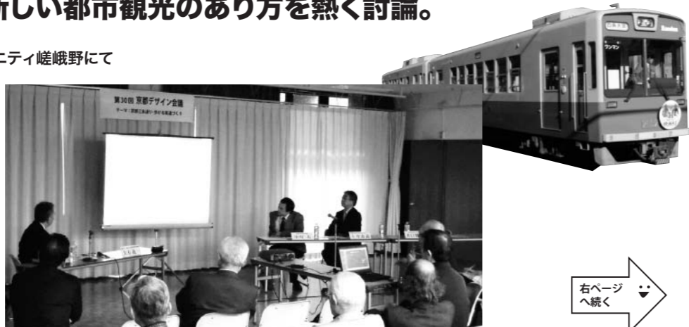
熱い討論を繰り広げる会議風景