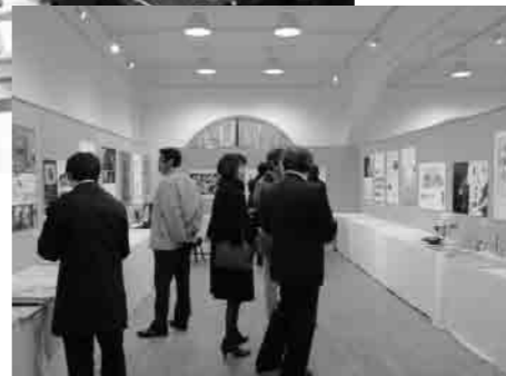
入賞作品の展示風景

11月28日(土)には、表彰式・シンポジウム・交流会が行われました。会場となった新風館のレストランには、80名におよぶ参加者があり、熱気あふれる会場となりました。表彰式は、大賞を始め、京都府知事賞、市長賞、商工会議所会頭賞、学生賞を各担当責任者からトロフィーや賞状を直接お渡し頂きました。