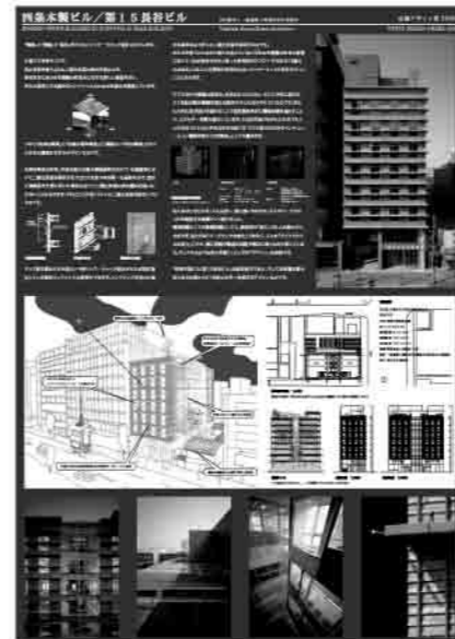
大賞作品 四条木製ビル/第15長谷ビル

●表彰式・シンポジウム・交流会=2009年11月24日 ●作品展=2009年11月24日～30日 新風館 創作カフェダイニング Angely